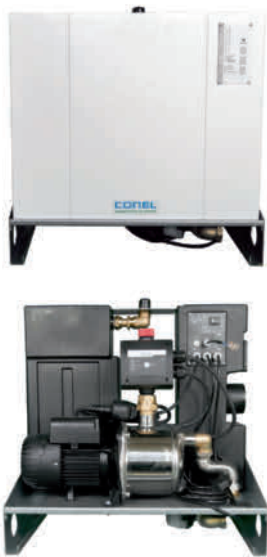
Abb. Modell ohne Füllstandsanzeige

Kompakter, anschlussfertiger Regen-Meister zur Steuerung der Wasserversorgung mit Regenwasser. Ideal für die Wasserversorgung für Toilettenspülungen, Waschmaschinen oder Gartenbewässerung.